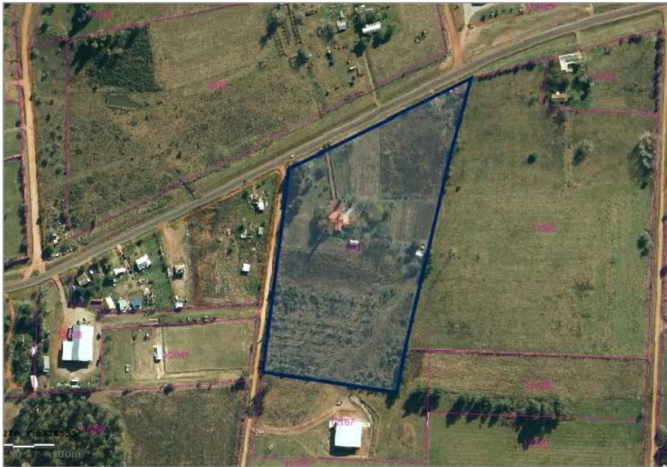
PLANTA UBICACIÓN Foto Aerea